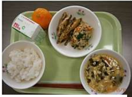
高岡市五井中学校の学校給食 (昨年5月30日視察)

町長選挙実施のため、議会は6月の臨時議会と1カ月遅れの7月議会が開催されました。