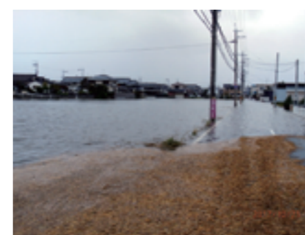
水害被災地を調査