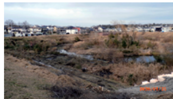
改修工事が進む真美ヶ丘池