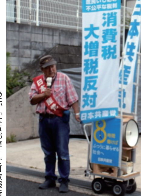
愛称「大五郎車」で町政報告