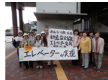
五位堂駅にエレベーターが設置