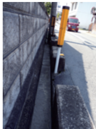
狭い県道の安全点検に参加