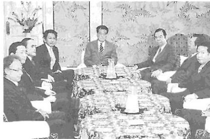
多くの国民の「野党は共闘」の願いを受けて、戦争法廃止、選挙協力で合意した5党首会議 (2月19日、国会)

力をあわせ政治を変える — 国民と5野党がスクラム アベ自公政治ストップの声をとどける人